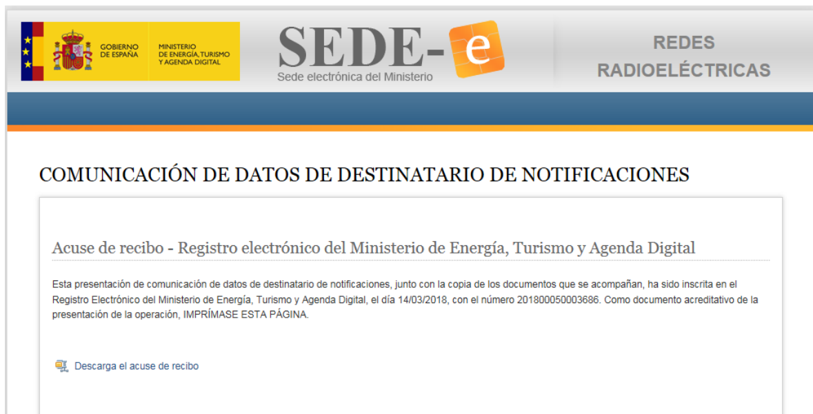
Figura 8- Pantalla Acuse de Recibo

Una vez firmados los datos de la solicitud se accede a la siguiente pantalla donde puede descargar el Acuse de Recibo de la Presentación: